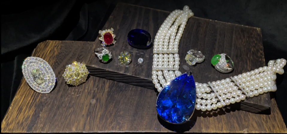
32.486ct エメラルドカット ダイヤモンド リング

刻印: Pt900 32.486 D2.867 Fancy Intense Yellow-VS2 20.27 × 15.91 × 11.20mm Polish: Good Symmetry: Good Fluo: None