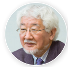
安村 敏信 Toshinobu Yasumura